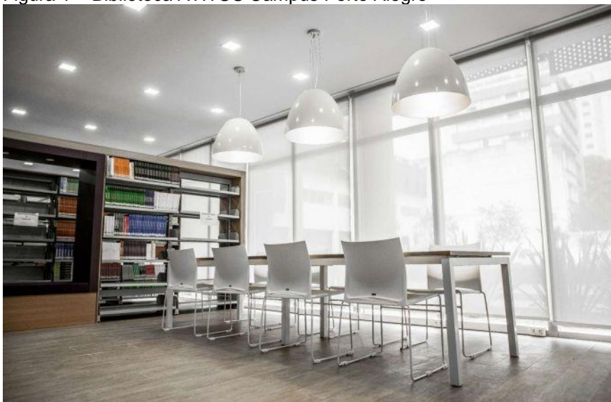
Figura 1 – Biblioteca ATITUS Campus Porto Alegre